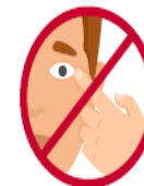
No te toques la cara hasta que tengas las manos bien limpias.