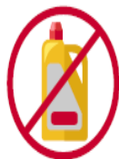
No utilices productos con lejía o agua oxigenada para el interior del coche.