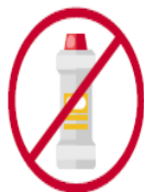
No limpies con amoníaco las pantallas táctiles de tu vehículo.