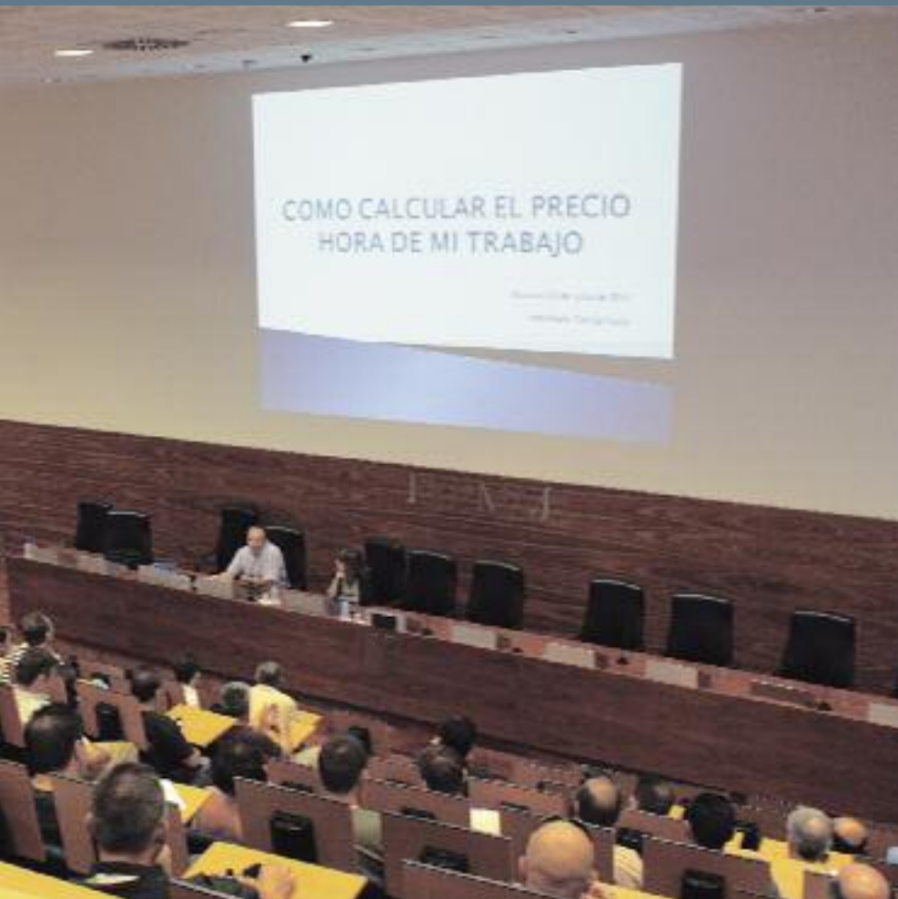
un acto divulgativo, es tremendamente eficiente y sencillo para calcular el precio de la hora de trabajo en las

INSTAGI, Asociación Empresarial de Instaladores y Mantenedores de Guipuzcoa, para el cálculo del coste hora de los trabajadores en una pyme.