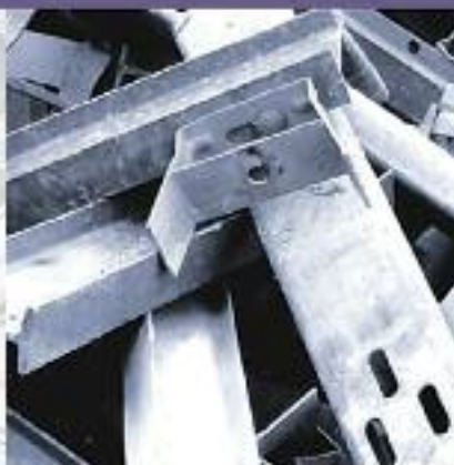
Red de clientes y proveedores