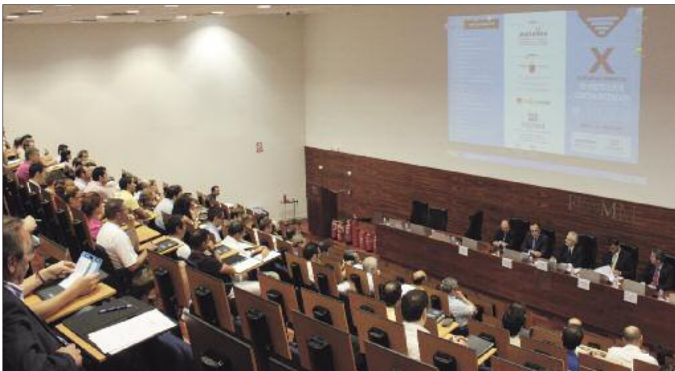
ÉXITO. La Jornada Contra Incendios de ADEIM celebró su X edición con los mismos ánimos que la primera, conscientes del avance permanente en la calidad de su servicio.