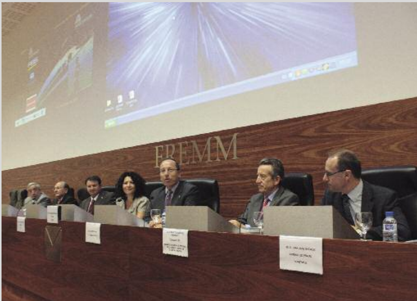
PROVECHOSA JORNADA. La Primera Jornada Técnica de Seguridad contó con una gran asistencia.