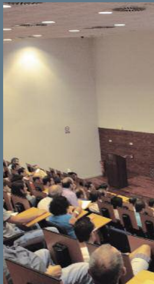
UTIL. El programa que ahora ofrece FREMM, presentada en pequeñas y medianas empresas.

Federación. Todos aquellos profesionales y empresas interesadas pueden solicitar el programa a través del email: mjaragon@fremm.es Por supuesto, el objetivo es que todo aquel que lo utilice aumente su competitividad gracias a una mejora de la gestión y conocimiento de sus ingresos y gastos.